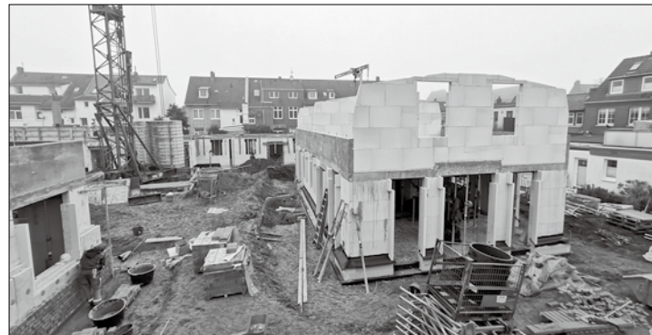
Die Arbeiten an den Gebäuden der sogenannten Gartenstadt schreiten planmäßig voran.