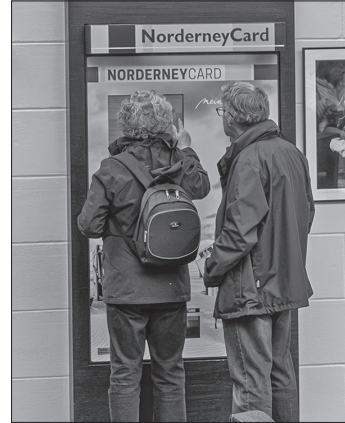
Das Staatsbad baut wenig genutzte Norderney-Card-Automaten zurück. Gut erreichbare Standorte bleiben bestehen.

ten werden technisch und optisch aufgefrischt beziehungsweise wieder in Betrieb genommen“, heißt es weiter: „Ziel ist es, die vorhandene Infrastruktur an den relevanten Standorten zuverlässig, zeitgemäß und nutzerfreundlich bereitzustellen. Mit der Neuordnung verbindet das Staatsbad eine sachliche Anpassung an die tatsächliche Nachfrage. Während einzelne Automatenstandorte zuletzt nur noch gering genutzt wurden, gewinnen digitale Wege weiter an Bedeutung.“