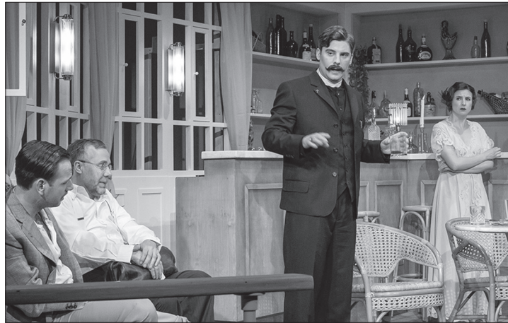
Die Landesbühne spielt heute den Agatha Christie Kriminalklassiker „Tod auf dem Nil“

Norderney – Ein Nil-Dampfer, eine Hochzeitsreise und ein Mord: Mit Agatha Christies Kriminalklassiker „Tod auf dem Nil“ gastiert die Landesbühne Niedersachsen Nord am heutigen Dienstagabend im Kurtheater.