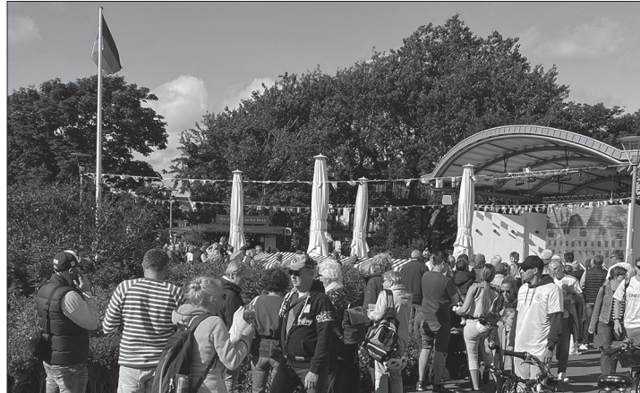
Auf dem Kurplatz gibt es zur Fußball-WM wieder Live-Übertragungen ausgewählter Partien.

Norderney – Mit dem Eröffnungsspiel Mexiko gegen Südafrika beginnt am heutigen Donnerstag die diesjährige Fußball-Weltmeisterschaft der Herren. Das Turnier wird erstmalig mit 48 teilnehmenden Mannschaften in drei Ländern Kanada, Mexiko und den USA ausgetragen. Wer das Turnier gemeinsam mit Gleichgesinn-