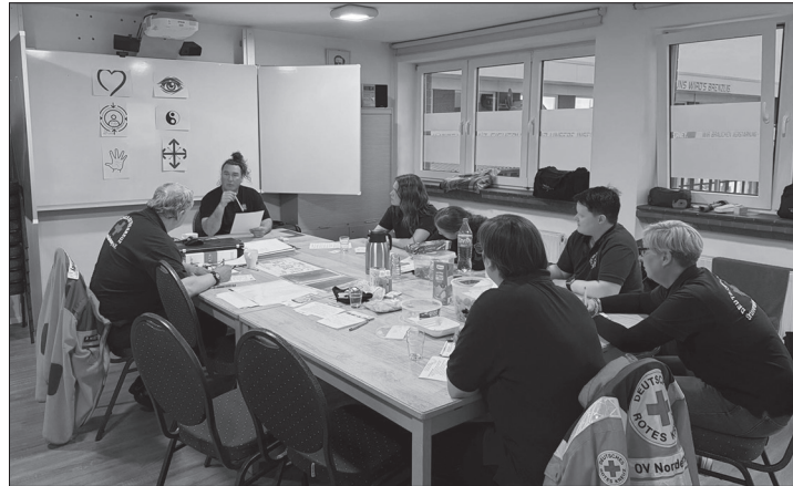
Situationen frühzeitig erkennen und Konflikte vermeiden – darum ging es in einem dreistündigen Präventionskurs.

(ape) – Wenn das Deutsche Rote Kreuz auf Norderney (DRK) bei Großveranstaltungen im Einsatz ist, geht es um schnelle Hilfe, medizinische Versorgung und Unterstützung vor Ort. Doch die Helfer erleben dabei nicht immer nur angenehme Situationen. Gerade bei größeren Veranstaltungen wie White-Sands und Summertime können sich Konflikte anbahnen, die sich weiter zuspitzen. Der DRK-Ortsverein setzt nun auf Prävention und führte am vergangenen Mittwoch eine Schulung für Deeskalation, Gewaltprävention und Notwehr durch.