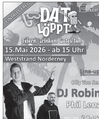
Plakat: Fest Gemacht

Rund um das Himmelfahrtswochenende erwarten die Veranstalter zahlreiche Gäste auf der Insel. Mit „Dat Löppt“ entsteht ein zusätzlicher Treffpunkt, der Urlauber und Insulaner gleichermaßen ansprechen möchte.