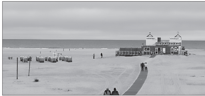
Dem Land Niedersachsen liegt seit zwei Monaten ein Unterstützungsgesuch des Staatsbades für den Aufbau der Badestrände im Inselosten vor.