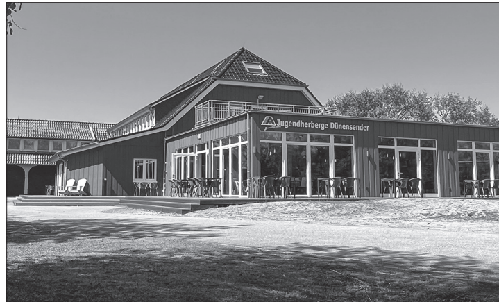
Die Jugendherbergen auf der Insel erwarten für 2026 eine bessere Saison als im Vorjahr.