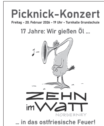
Plakat: Zehn im Watt

Norderney – Zum gemütlich-warmen Picknick-Konzert lädt das Norderneyer Tiefblechensemble „Zehn im Watt“ alle Interessierten am morgigen Freitagabend in die Turnhalle der Grundschule in der Jann-Berghaus-Straße ein. Zu feiern gibt es das 17-jährige Bestehen der Gruppe, und so lautet das Konzertmotto: „17 Jahre – Wir gießen Öl in das ostfriesische Feuer“. Mit Es-Horn, Euphonium, Mellophon, Posaune, Bariton und Tuba spielen sie Lustiges, Bekanntes, weniger Bekanntes, Mitsing- und Zuhörbares, Pop, Rock und Schlager, so die Ankündigung. Wer möchte, kann