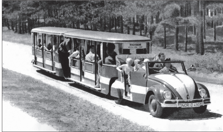
Bis in die Sechzigerjahre hinein fuhr die Bahn auf Norderney zwischen Inselosten und Innenstadt.

Ihren ersten öffentlichen Auftritt wird die Zugmaschine bereits am 31. Januar bei der Oldtimer-Motorschau in Bremen bestreiten, kündigt Grundmann an: Am Stand des Käferclubs Wolfsburg wird ihr dort ein neuer Motor eingebaut.