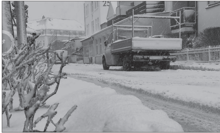
Kaum ist die Kehrmaschine vorbeigefahren, bildet sich schon die nächste Schneeschicht – wie hier in der Winterstraße.

Die Stadt Norderney weist mit Blick auf die aktuelle Wetterlage darauf hin, dass die Anwohnerinnen und Anwohner verpflichtet sind, die Gehwege einschließlich gemeinsamer Rad- und Gehwege auf mindestens 1,50 Meter Breite freizuräumen sowie gänzlich, falls der Weg schmaler ist. „Feststellungen haben leider gezeigt, dass einigen diese Verantwortung nicht (mehr) bewusst ist“, heißt es in der entsprechenden Pressemitteilung. Weiter heißt es: „Ein Versäumnis dieser Räumpflicht trifft insbesondere ältere und gebrechliche Menschen, Rollstuhlfahrer oder Eltern, die mit Kinderwagen oder Kleinkindern unterwegs sind. Notwendige Besorgungen, Arztgänge oder Wege zu Schule und Kindergarten stellen auf unzureichend geräumten oder vereisten Gehwegen eine nicht abschätzbare Gefährdung dar. (...) Es ist daher dringend erforderlich, der Pflicht zum Winterdienst umfassend und zeitnah nachzukommen.“