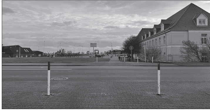
Am südlichen Ende des Gorch-Fock-Weges könnte schon bald ein zusätzlicher Zebrastreifen eingerichtet werden.

(ape) – Der Ausschuss für Wirtschaft, Tourismus und Verkehr empfiehlt, am Gorch-Fock-Weg einen zusätzlichen Fußgängerüberweg über die Straße „Zum Fähranleger“ einzurichten. Ausgangspunkt der Diskussion war der stark genutzte Übergang zwischen Hafen und Stadtkern. Fachbereichsleiter Jürgen Vißer stellte den Vorschlag der Stadtverwaltung vor und verwies auf den hohen Fußgängerverkehr, insbesondere nach Fährankünften. Viele Menschen überqueren dort die Straße bislang ungesichert. Den bestehenden Fußgängerüberweg an der Kreuzung Hafenstraße/Deichstraße nutzen Fußgänger nach Angaben der Verwaltung nur selten. Den Bedarf für eine zusätzliche Querung stellte die Stadt bereits bei einer Verkehrsbeurteilung am 19. Mai fest. Die zuständige Straßenverkehrsbehörde ordnete daraufhin die Einrichtung eines weiteren Zebrastreifens an. Die Technischen Dienste Norderney planen die Umsetzung nach den geltenden Vorgaben, unter anderem mit ausreichender Beleuchtung, guten Sichtverhältnissen und barrierefreiem Ausbau. Die Kosten veranschlagen