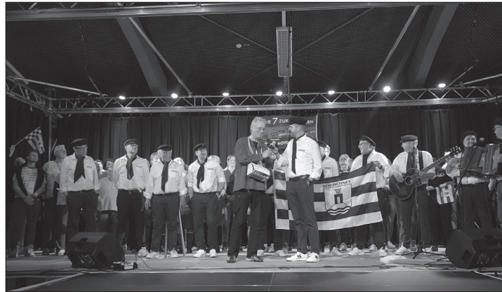
Nachdem die Norderneyer beim Insulaner unner sück im Frühjahr dieses Jahres auf Wangerooge ihr Können bewiesen haben, lädt nun Spiekeroog zu dem beliebten Kulturevent für Inselbewohner ein.

Auch das Programm wirft bereits seine Schatten voraus: Die Aufführungen am Freitag und Samstag sind im Sportdeck geplant, gefolgt von stimmungsvollen Partys in der benachbarten Kogge. Die Inselfschule lädt am Freitagnachmittag zu Kaffee und Kuchen ein, bevor am Samstagvormittag ein entspanntes Kennenlernen