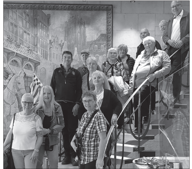
Knapp 15 ehemalige Norderneyerinnen und Norderneyer kamen wieder zu ihrem jährlichen Treffen zusammen.