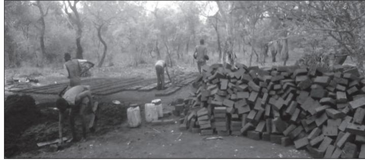
Im Rahmen von Food for Work konnte der Bau der Mädchenschule wieder aufgenommen werden

Norderney – Der derzeitige Konflikt im Südsudan gibt Anlass zu großer Sorge, schreibt Kanon Sylvester Kambaya in seiner aktuellen Mail von Anfang April. Während sich die Welt um Trump und Putin, um Ukraine und Israel dreht, gibt es Nachrichten, die in der Flut der Informationen fast untergehen. So wird wenig über den andauernden Krieg im Sudan berichtet. Und auch die schlimmen Neuigkeiten aus dem Südsudan sind kaum eine Nachricht wert, doch die Menschen leiden und es trifft meist die Ärmsten, so der Norderneyer Freundeskreis Kadeba: „Wenn sich nun, nach fast zwei Jahren Krieg im Sudan, auch noch der Südsudan breitflächig entzündet, hätte dies katastrophale Folgen für die notleidende Bevölkerung. Die Zone des Hungers und der