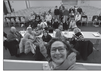
Jahreshauptversammlung beim Förderkreis

Wie wichtig dem Verein das Engagement für die Kinder ist, zeigt sich unter anderem bei der Einschulung der Erstklässler, die mit Verpflegung und Herz begleitet wurde. Ein Höhepunkt war das Kinderfest der Grundschule, das