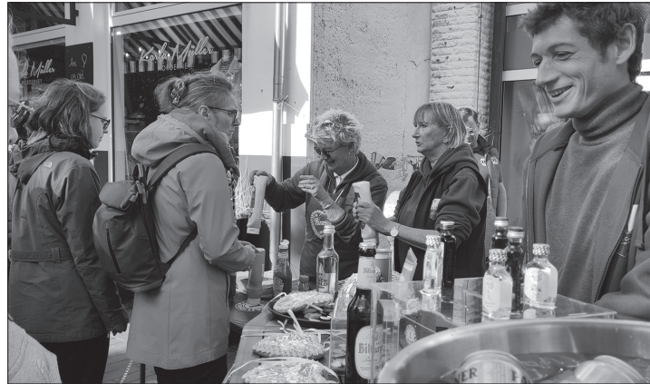
Die Wurst am Tresen wurde nicht nur mit Senf, sondern auch mit reichlich guter Laune garniert.

Norderney – Der Lions Club Norderney 2018 kann auf den Erfolg des ersten kleinen Oktoberfestes am Tag der Deutschen Einheit zurückblicken. Gut 500 Flaschen Bier und rund 440 Bratwürstchen gingen für den guten Zweck bei der Veranstaltung vor der Park-Apothekē über den Tresen, ebenso 30 Portionen Fleischkäse und 50 Laugenbrezeln. Die Männer und Frauen des Serviceclubs sorgten zudem mit Schlagermusik für reichlich gute Laune.