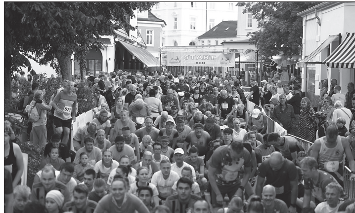
Beim Meine-Insel-Lauf im Juli werden in diesem Jahr zwei neue Streckenformate angeboten.

(dol) – Am 13. Juli findet auf Norderney der alljährliche Meine-Insel-Lauf statt. Neben den bereits bewährten Strecken über fünf und zehn Kilometern sowie den Schüler- und Bambiniläufen bieten die Veranstalter erstmals auch einen Halbmarathon über 21,0975 Kilometer an. Dieser wird auf der südlichen Inselseite Richtung Osten zum Leuchtturm führen und an der Nordseite wieder zurück zum Stadtkern und ins Ziel, so die Ankündigung. Die Halbmarathon-Strecke wurde bereits professionell durch einen Vertreter des TÜV vermessen. „Der Halbmarathon ist eine Aufwertung und kann durchaus ein Ersatz für den Marathon sein, weil es im Moment als Format deutlich stärker nachgefragt und deutlich beliebter ist“, so dazu