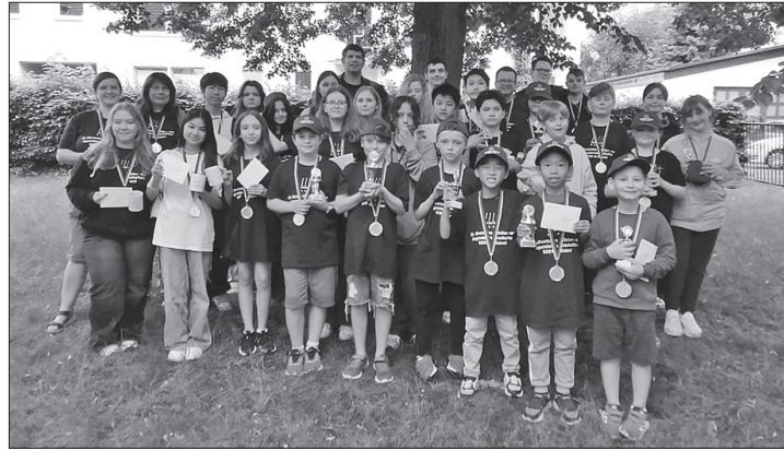
Dabei sein ist alles: Eine Medaille gab es für alle Teilnehmerinnen und Teilnehmer an der Deutschen Schüler- und Jugend-Skatmeisterschaft.

Doch neben dem Skatspiel stand vor allem der Spaß im Mittelpunkt, und so hatten die Veranstalter für die Kinder