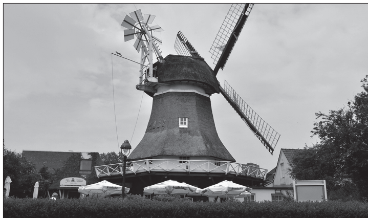
Ab Mitte Juni könnte auf dem Mühlenvorplatz bereits ein gastronomisches Angebot eingerichtet werden