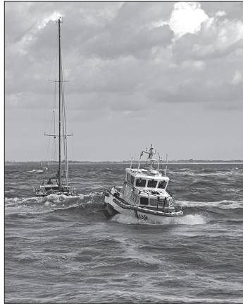
Im Schlepp der OTTO DIERSCH bringen die Seenotretter das havarierte Segelboot in den Hafen.

Der Seenotrettungskreuzer EUGEN der Station Norderney und das Seenotrettungsboot OTTO DIERSCH der Station Norddeich waren im Einsatz. Der Freiwilligen-Besatzung der OTTO DIERSCH gelang es unter schwierigsten Bedingungen, eine Leinenverbindung zum festgekommenen Segelboot herzustellen und das Boot freizuschleppen. In Begleitung des Seenotrettungskreuzers EUGEN brachten die Seenotretter