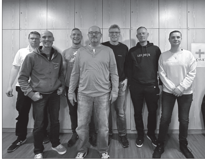
Der neue Vorstand des Pokervereins „Ney's Pokerfaces“ ist seit vergangem Montag im Amt.