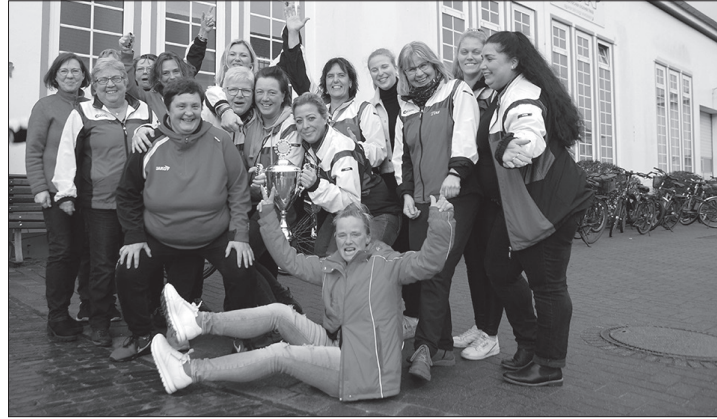
Auch die Werferinnen vom Team Wasserbau durften erneut den Meisterschaftspokal in Händen halten.

In seiner Ansprache kündigte Trebsdorf zudem an, dass er nur noch für das nächste Jahr