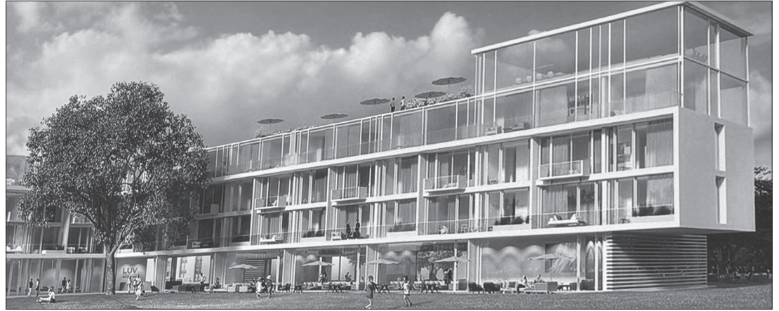
Mit viel Glas haben die Planer das Hotel zur Südwestseite gestaltet.

Auf drei Etagen soll das Hotel Platz für 99 Zimmer und Suiten für Hotelgäste bieten sowie 13 Mitarbeiterwohnungen, einen SPA-Bereich, einen Fitnessbereich, ein Restaurant, eine begrünte Dachterrasse mit Bar sowie eine Geschäftszeile für ein Café und einen SPA-Shop beinhalten. Im Untergeschoss sind eine Tiefgarage mit 22 Pkw-Stellplätzen und eine unterirdische Verbindung zum Badehaus geplant. Im südwestlich gelegenen Außenbereich sind ein Außenpool für den Spa-Bereich und eine Grünan-