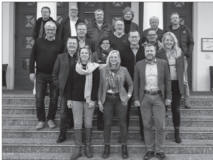
Die Vertreter der Ostfriesischen Inseln nach zwei arbeitsintensiven und harmonischen Tagen des Austauschs.