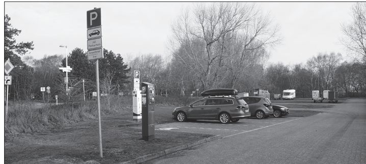
Der Parkplatz gegenüber vom Bahnhof Stelldichein ist heißer Kandidat für eine neue Bleibe für den Rettungsdienst.