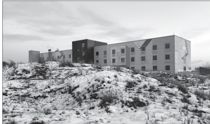
Für das Norderneyer Krankenhaus hat sich der Aufwand bei der Suche nach einer weiteren wohnortnahen Versorgung für kritisch-kranker Patienten erhöht.

Dass sich die Befürchtungen nun bestätigen, zeigt sich in einem höheren Aufwand bei der Patientenverlegung in Krankenhäuser am Festland, berichtet der Chefarzt der Inneren des Inselkrankenhauses Lutz Brandt auf Nachfrage. „Wir merken das schon“, sagt Brandt und erzählt von dem Zeit- und Arbeitsaufwand bei der Suche