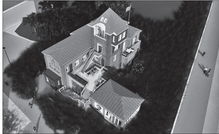
Ein Museumsbereich im Erdgeschoss, Mitarbeiterräume in der Zwischenebene und der Malerturm als Wahrzeichen – so schlägt es der Entwurf des Architekturbüros vor. Skizze: Bertzbach Architekten

Norderney/dol – Mit dem Ziel, das Werk des Seemalers Poppe Folkerts der Öffentlichkeit zugänglich zu machen, hatte sich im August 2010 die Fördergemeinschaft Poppe-Folkerts-Museum gegründet. Mit dabei war stets die Idee, den Malerturm der Familie Folkerts am Norderneyer Weststrand wieder aufzubauen, in dem der Maler sein Atelier hatte und der im Zuge des Zweiten Weltkriegs abgebrochen worden war, sodass heute nur noch ein Teil des Wohnhauses erhalten ist. Im Dezember vergangenen Jahres hat der Verein einen neuen Konzeptentwurf des Cappeller Architekturbüros Bertzbach veröffentlicht, der den Wiederaufbau des Malerturms und die zusätzliche Einrichtung eines Museumsbereichs vorsieht. Auf das bestehende Erdgeschoss