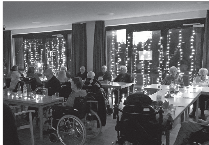
Bei Kerzen und Musik genossen die Bewohner das Lichterfest im Seniorenzentrum To Huus.

Norderney – Das Norderneyer Duo Querbeet gastierte am vergangenen Freitag auf dem Lichterfest im Seniorenzentrum To Huus. In einem mit vielen Lichtern und Kerzen geschmückten Raum genossen die Bewohnerinnen und Bewohner gemütliche Atmosphäre. „Es war schön anzusehen, wie beruhigend