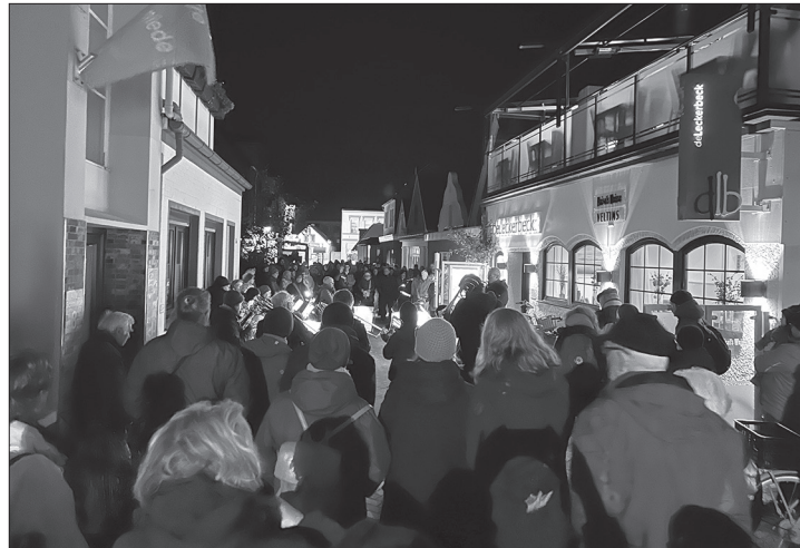
Zahlreiche Menschen gedachten am vergangenen Donnerstagabend vor der ehemaligen Synagoge der Opfer der Reichspogromnacht.

(ape) – Weit mehr als hundert Norderneyer und Gäste versammelten sich am vergangenen Donnerstagabend bei der ökumenischen Gedenkveranstaltung der Norderneyer Kirchengemeinden anlässlich des 85. Jahrestages der Pogromnacht in der Schmiedestraße. Dort stand von 1878 bis 1933 eine Synagoge, die für Einheimische und Gäste erbaut worden war. Norderney war damals die einzige der Ostfriesischen Inseln, auf der Juden zunächst noch willkommen waren. Ab 1933 griff auch auf Norderney der Antisemitismus um sich und viele Juden verließen in den nachfolgenden Jahren die Insel. Die Synagoge wurde im Juli 1938 verkauft und entging damit der Pogromnacht. In ei-