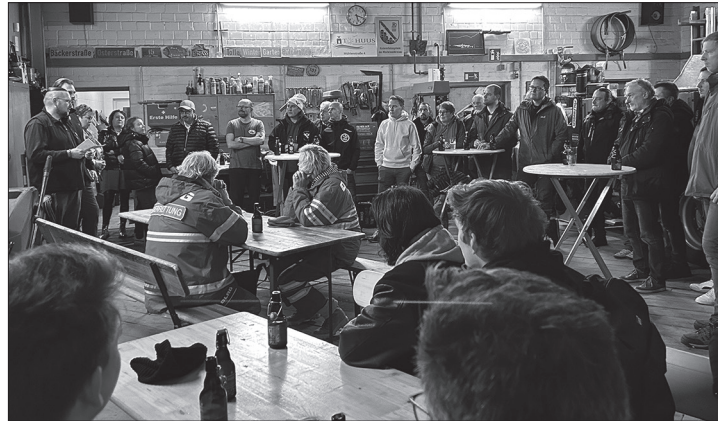
Musiker, Organisatoren und zahlreiche Helfer waren auf der Helferparty des Musikfestes und feierten das gute Ergebnis.

(ape) – Trotz des Regens war das diesjährige Norderneyer Musikfest mit über 1.100 Besucherinnen und Besuchern so erfolgreich wie noch nie. Sieben Inselbands heizten dem Publikum bei dem Open-Air-Festival auf dem Jacob-Onnen-Betriebsgelände souverän ein und sorgten für reichlich Durst und volle Kassen. 8.000 Euro Erlös standen am Ende unter dem Strich, die die Organisatoren auf der Helferparty am vergangenen Samstagabend an Norderneyer Vereine und Gruppen spendeten. Sie bedachten die Jugend des Turn- und Sportvereins Norderney mit 1.000 Euro, die DLRG-Ortsgruppe für die Jugendarbeit mit 2.000 Euro und die Seglerjugend mit 500 Euro. Freuen konnten sich außerdem die Boßeljugend über 1.000 Euro sowie der Förderkreis Norderneyer Schulen