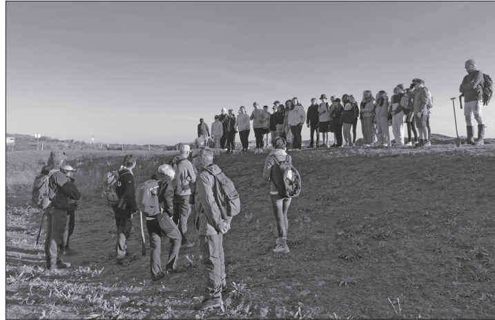
Gemeinsam mit Nationalparkranger Niels Biewer sammelten die Schüler der siebten Klassen Müll im Inselosten.

Norderney – Im Rahmen des Internationalen Coastal-Clean-up-Day machten sich sieben Mitglieder des Bundes für Umwelt und Naturschutz Deutschland (BUND) und 35 Norderneyer Schülerinnen und Schüler der siebten Klassen am Freitag, 15. September, zum Strand zwischen Möwendüne und Wrack auf den Weg, um die Natur von Müll zu befreien. Mit Erfolg, denn der Inselnachwuchs sammelten an diesem Tag 2,6 Tonnen Müll. In diesem Jahr fanden sie neben Plastikverpackungen und sonstigem Plastikmüll auch Gefahrgüter wie einen gefüllten Dieseltankbehälter. Den größten Gewichtsanteil machten allerdings Fischernetze aus, teilte der BUND Norderney mit. Die Netze gehen während des Fischens verloren, fischen