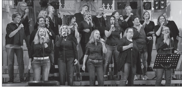
Der Gospelchor lädt heute zu einem Benefizkonzert für den Freundeskreis Kadeba ein.

Im September 2013 gründete sich der Freundeskreis Kadeba zur Unterstützung der Gemeinde Kadeba im Südsudan. Seitdem konnte mit Hilfe der Norderneyer die Einrichtung eines Geburtshauses, der Bau einer weiterführenden Schule für Mädchen und junge Frauen sowie ein Traumabewältigungsprojekt für Bürgerkriegsbetroffene unterstützt sowie Hunger- und Überlebenshil-