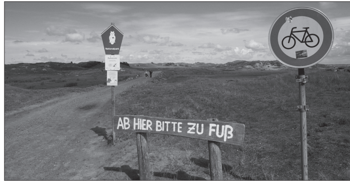
Zu den geplanten Erdgasförderungen im Wattenmeer hat das UNESCO-Welterbekomitee Stellung bezogen.

(dol) – Das Welterbekomitee der UNESCO hat im Rahmen seiner kürzlichen Sitzung im saudi-arabischen Riad seine Sorge über geplante Öl- und Gasförderprojekte und weitere wirtschaftliche Aktivitäten im Weltnaturerbe Wattenmeer zum Ausdruck gebracht. Seit dem Jahr 2019 werde die UNESCO regelmäßig über Entwicklungen in Kenntnis gesetzt, die den besonderen universellen Wert des Wattenmeers beeinflussen könnten, heißt es in dem gefassten Beschluss.