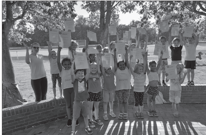
Die Kinder stellten in den Disziplinen Laufen, Springen und Werfen ihr Können unter Beweis.

Norderney – Die Leichtathletik-Kids trafen sich in der vergangenen Woche auf dem Sportplatz an der Mühle, um das Mini-Sportabzeichen zu erwerben. Bei hochsommerlichen Temperaturen konnten die teilnehmenden Kinder mit viel Spaß in den Disziplinen Laufen, Springen und Werfen ihr Können unter Beweis stellen. Ihre sportlichen Leistungen wurden von den Eltern bejubelt. Im Anschluss folgte ein Staffellauf gegen die Eltern, der für Furore sorgte, so die Mitteilung vom TuS Norderney. Der Wettkampf endete mit einem deutlichen Unentschieden.