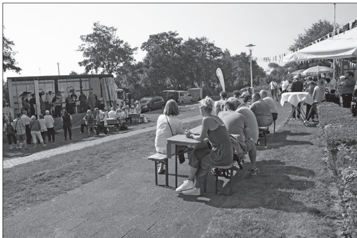
Der AWO-Ortsverein feierte am gestrigen Sonntag sein 75-jähriges Bestehen.