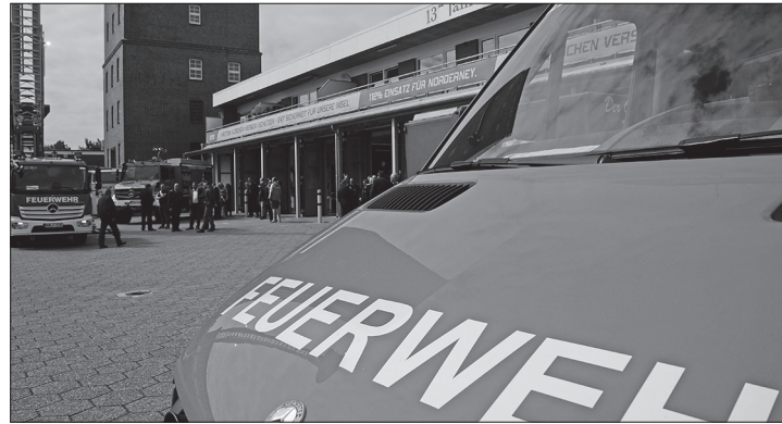
Die Stadt Norderney erwägt eine Erhöhung der Gebühren für Einsätze der Freiwilligen Feuerwehr.

(dol) – Mehr als zehnmal musste die Freiwillige Feuerwehr Norderney alleine im vergangenen August zu ausgelösten Brandmeldeanlagen (BMA) ausrücken. In den meisten Fällen waren dabei weder Feuer und Rauch auszumachen. Für Einsätze wie diese kann die Stadt von den Betreibern Gebühren erheben, ebenso bei Türöffnungen, vorsätzlich gelegten Bränden oder auch für Brandsicherheitswachen. Auf Antrag der Stadtverwaltung hat im August der Norderneyer Wirtschaftsausschuss geschlossen einem Empfehlungsbeschluss zugestimmt, mit der die Gebührensätze künftig deutlich steigen sollen. So sollen die Tarife für das eingesetzte Feuerwehrpersonal mehr als verdoppelt werden, von bisher 22 Euro auf 55 Euro je halber Stunde. Kommt die Drehleiter zum Einsatz, soll diese künftig mit 840 Euro statt bisher 208,50 Euro je halber Stunde