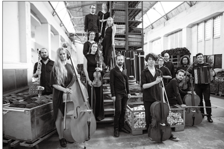
Die Ensembles des Orchesters im Treppenhaus verabschieden sich mit einem Konzert in vier Akten.

Der Abschlussabend am morgigen Dienstagabend verspricht noch einmal ein besonderes Konzerterlebnis. In drei persönlich abgestimmten Behandlungsrunden wird das Publikum im historischen Kurtheater, im Weißen