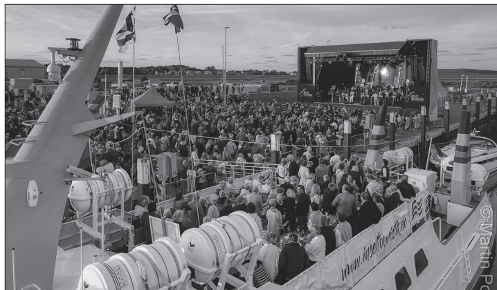
Über 3.000 Menschen besuchten das Benefizkonzert mit der Big Band der Bundeswehr im Norderneyer Jachthafen.