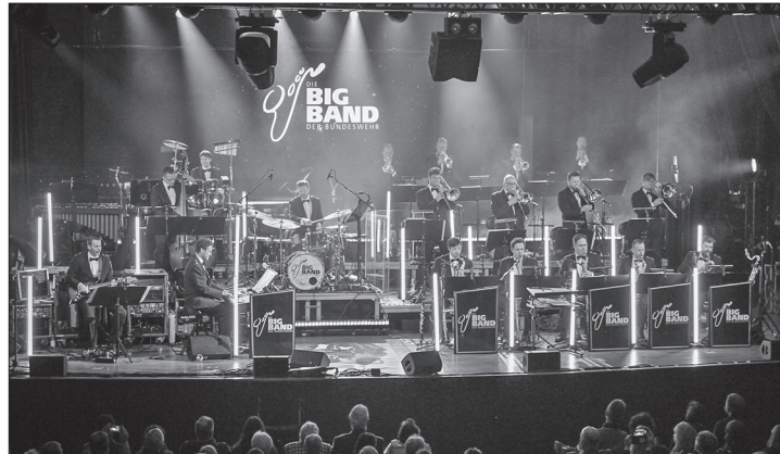
Am morgigen Mittwoch gastiert die Big Band der Bundeswehr auf Norderney.

Norderney – Die Big Band der Bundeswehr gastiert am morgigen Mittwochabend erstmals zu einem musikalischen Open-Air-Sommer-Highlight mit Swing, Pop und Rock auf Norderney. Das Publikum darf sich auf virtuos dargebotene Livemusik vor dem stimmungsvollen Hafenumgebung freuen.