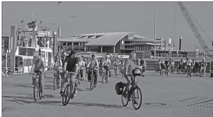
Mehr planerische Beachtung des Radverkehrs forderten die Teilnehmer der Radtour am vergangenen Freitag.

Norderney/dol – In Anlehnung an die weltweite Bewegung „Critical Mass“ starteten am vergangenen Freitagabend rund 40 Radfahrerinnen und Radfahrer vom Hafen aus zu einer Tour über die Insel. Mit der Aktion fordern sie eine höhere Beachtung des Radverkehrs in der Norderneyer Verkehrsplanung. Auch die Ratsherren der Norderneyer Grünen-Fraktion nahmen an der Aktion teil. „Das wichtigste Verkehrsmittel auf Norderney, das Fahrrad, wird immer wieder in konfliktreiche Situationen mit Fußgängern und Autofahrern geführt, die erheblich besser gelöst werden könnten“, heißt es in einer Pressemitteilung der Norderneyer Initiative „Aufsatteln“, die hinter der Aktion steht: „Beispielsweise könnte die An- und Abfahrt zu Fähre und Fahrradparkhaus besser über eine separate Fahrradspur am Rand der Autoaufstellfläche geführt werden als über die Engstelle