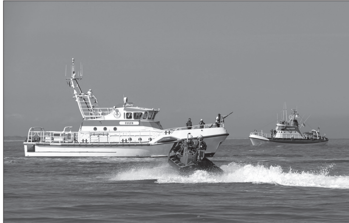
Am heutigen Tag der Seenotretter zeigt die Crew von dem auf Norderney stationierten DGzRS-Rettungskreuzer Hans Hackmack Rettungsmanöver am Weststrand.

(ape) – Die Deutsche Gesellschaft zur Rettung Schiffbrüchiger (DGzRS) gibt am heutigen „Tag der Seenotretter“ am Rettungsbootschuppen am Weststrand Einblicke in ihre Arbeit und die Geschichte der Seenotrettung auf Norderney. Von 11 bis 17 Uhr präsentieren die ehrenamtlichen Mitarbeiterinnen und Mitarbeiter der DGzRS ein umfangreiches Programm. So wird die Crew des Norderneyer Seenotrettungskreuzers Hans Hackmack um 11 Uhr und um 14 Uhr Manöverfahrten im Bühnenfeld vor dem Rettungsbootschuppen zeigen. Vom Rettungsbootschuppen aus werden die Rettungsmanöver moderiert und erläutert.