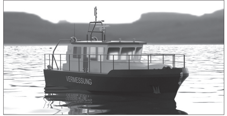
Grafik: Computermodell des NLWKN

Um diese Aufgaben zu bewerkstelligen, wird das Vermessungsschiff unter anderem mit einem Fächerecholot und einem Sedimentecholot ausgestattet. Geplant sind außerdem Vorrichtungen zum Aussetzen von Gewässersonden und eines auto-