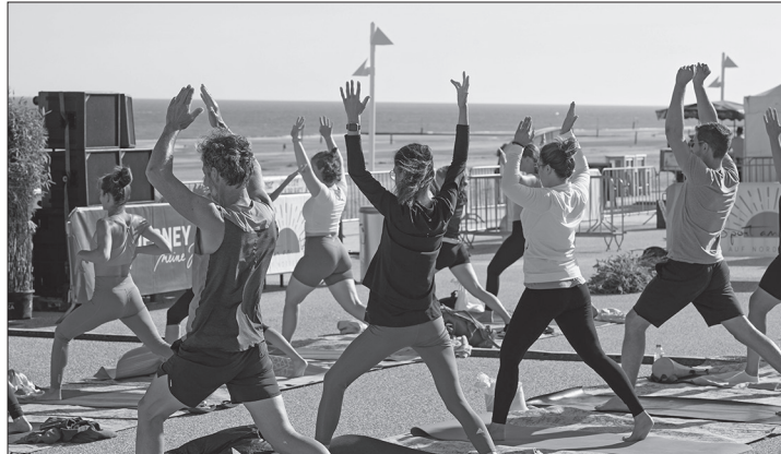
Die Sport- und Kulturreihe am Nordstrand war trotz der verkürzten Dauer ein Erfolg.