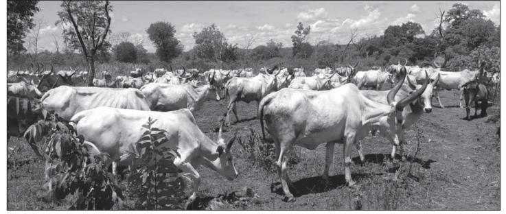
Die Rinder haben den gesamten Maniok auf den Feldern gefressen und die Wüstenbildung hat begonnen.