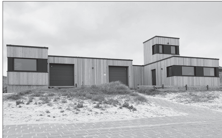
Der Surfverein lädt morgen zur offiziellen Einweihung der neuen Surfbox am Nordstrand ein.

Norderney – Der Surfverein Norderney weiht am morgigen Mittwochnachmittag die neue Surfbox am Nordstrand um 16 Uhr ein. Zu diesem Termin werden unter anderem die Förderer des Wattenmeer-Achters, der Norderneyer Bürgermeister Frank Ulrichs sowie Kurdirektor Wilhelm Loth anwesend sein.