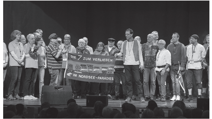
Auf dem Insulanertreffen im März auf Borkum ging die Ausrichterfahne an die Vertreter von der Insel Langeoog.

Langeooger: „Die Preise gehen dabei bei den Häusern so weit auseinander, dass eine Kalkulation eines Unner-Sück-Preises kaum möglich ist.“ Die Organisatoren konnten aber mehrere Gästehäuser, Hotels und Pensionen gewinnen, mit denen ausreichend Zimmer in guter Qualität zur Verfügung stehen. „Der Vorteil ist, dass alle Inseln an wenigen Stellen zusammen wohnen“, freut sich Kremer: „Für alle, die trotzdem gerne in einem der weiteren Langeooger Hotels wohnen möchten, bieten wir eine Unner-sück-Pauschale ohne Übernachtung an mit Fahrticket, Gästebbeitrag, Abend- und Mittagessen, dem traditionellen Band mit Namensschild und einem kleinen Geschenk.“ Bei der