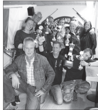
Sieger des Vereine-Pokalschießens von 2019