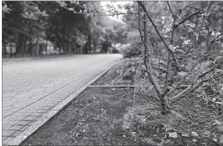
Ist der von der Stadtgärtnerei angebrachte Schutz aus Draht oder Plastik erst zerstört, überleben die jungen Pflanzen und Bäume die Fraßschäden durch die Kaninchen in der Regel nicht.