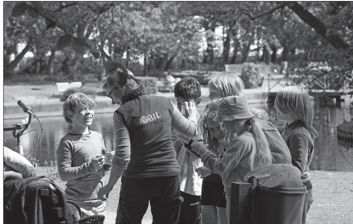
Mit der Becherlupe entdecken die Schüler der 3a die Natur im Park der Napoleonschanze.