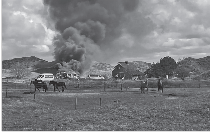
Die Rauchsäule des Schuppenbrandes war bereits von Weitem zu sehen.

Norderney – Die Freiwilligen der Feuerwehr wurden am Dienstagnachmittag zu einem Schuppenbrand alarmiert. Der Einsatzort war ein etwas abgelegenes Haus am Karl-Rieger-Weg, heißt es in dem Bericht der Norderneyer Feuerwehr. Die Rauchsäule war bereits von Weitem zu sehen.