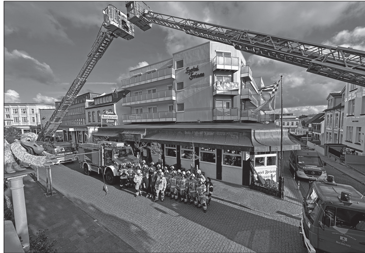
Auf der Jubiläumsfeier sammelte das Hotel Friese Spenden und übergab diese an die Feuerwehr.