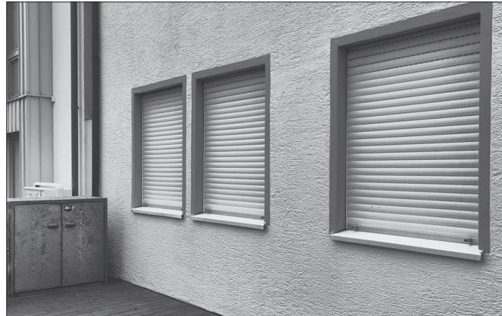
Genutzter Wohnraum statt Leere ist auf Sylt wie auf Norderney erklärtes Ziel der Kommunalverwaltung.

(dol) – Im vergangenen März hatte die Gemeindevertretung Sylt ein Beherbergungskonzept verabschiedet mit dem Ziel, weiteres Wachstum an Ferienbetten im Gemeindegebiet nicht mehr zuzulassen. Umgesetzt werden soll dieses Ziel über die Bauleitplanung, heißt es in der Umsetzungsstrategie, die die gemeindeeigene Stabsstelle Ortsentwicklung erstellt hat und die dem Konzept beigefügt ist. Als Grundlage für die Strategie hatte die Gemeinde das gesamte Gemeindegebiet hinsichtlich seiner planungsrechtlichen Situation untersucht und nach Dringlichkeit bewertet. Schritt für Schritt sollen nun zuerst die Gebiete überplant werden, für die bisher kein Bebauungsplan vorliegt. Anschließend sollen je nach Handlungsbedarf die bestehenden 122 Bebauungs-