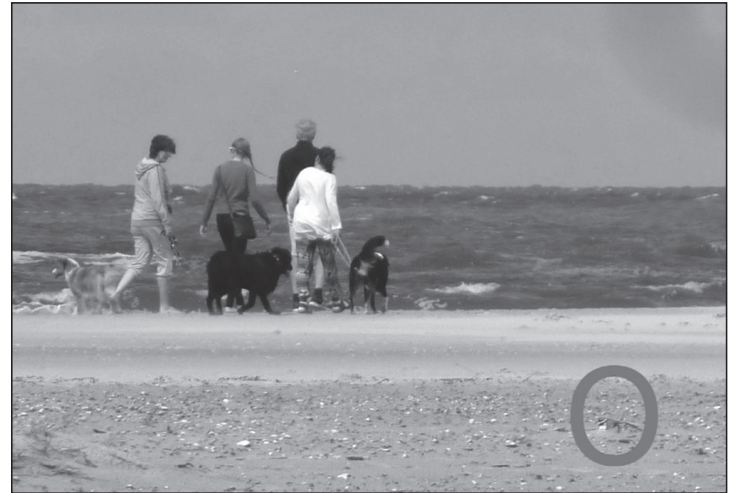
Die Gelege der Strandbrüter sind im Sand nur schwer zu erkennen.

„Das Prinzip bei den Strandbrütern ist tarnen und flüchten, wenn Gefahr droht“, schildert Nationalparkrangerin Frauke Gerlach auf Nachfrage. Die Elterntiere verlassen die Gelege zudem, wenn Hunde in der Nähe sind, da diese immer als Be-